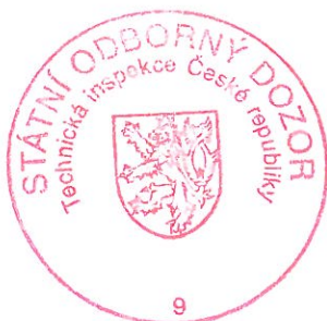
Ing. Petr Veselý vedoucí inspektor pobočky

Toto oprávnění nahrazuje oprávnění ev. č. 8003/9/98/EZ-M,O-E1A